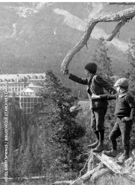
HOTEL BANFF SPRINGS

Comprendre le passé pour façonner un meilleur avenir.